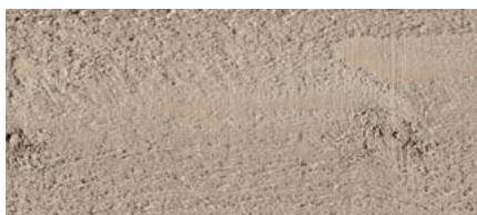
odstín č. 4470-M