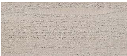
odstín č. 4259-M