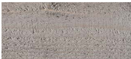
odstín č. 4880