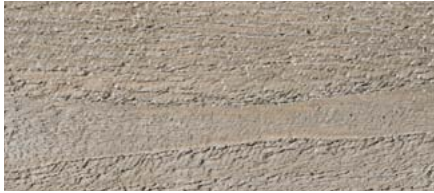
odstín č. 4470