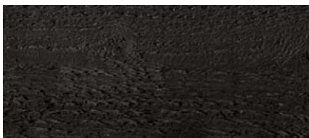
odstín č. 4895