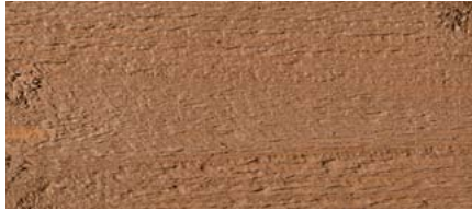
odstín č. 4735