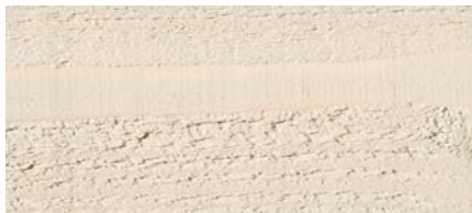
odstín č. 4863