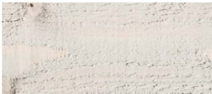
odstín č. 4861