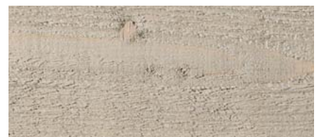
odstín č. 4832-M