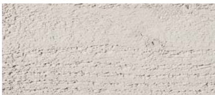
odstín č. 4875