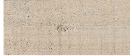
odstín č. 4832