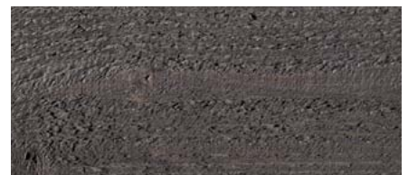
odstín č. 4890