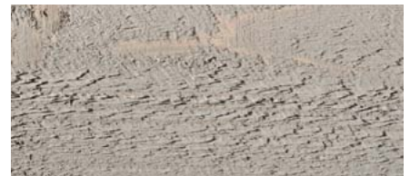
odstín č. 4870